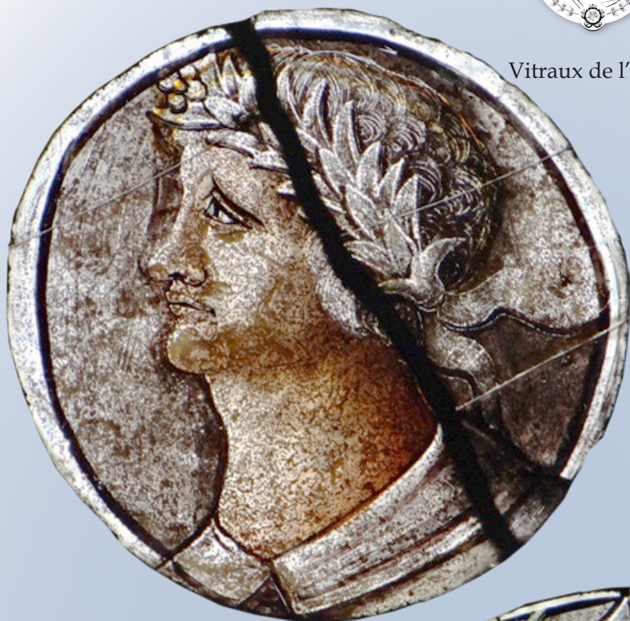
Vitraux de l'église de Chessy-les Mines (Rhône)

Jacques Coeur (v.1400- 1456), Grand Argentier de Charles VII, avait des intérêts dans les mines de Chessy et dans celles de la vallée de la Brévenne.