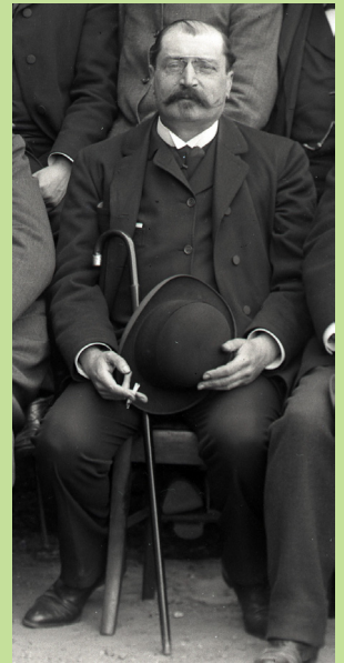
Abel Besançon, premier président du 20 ème siècle